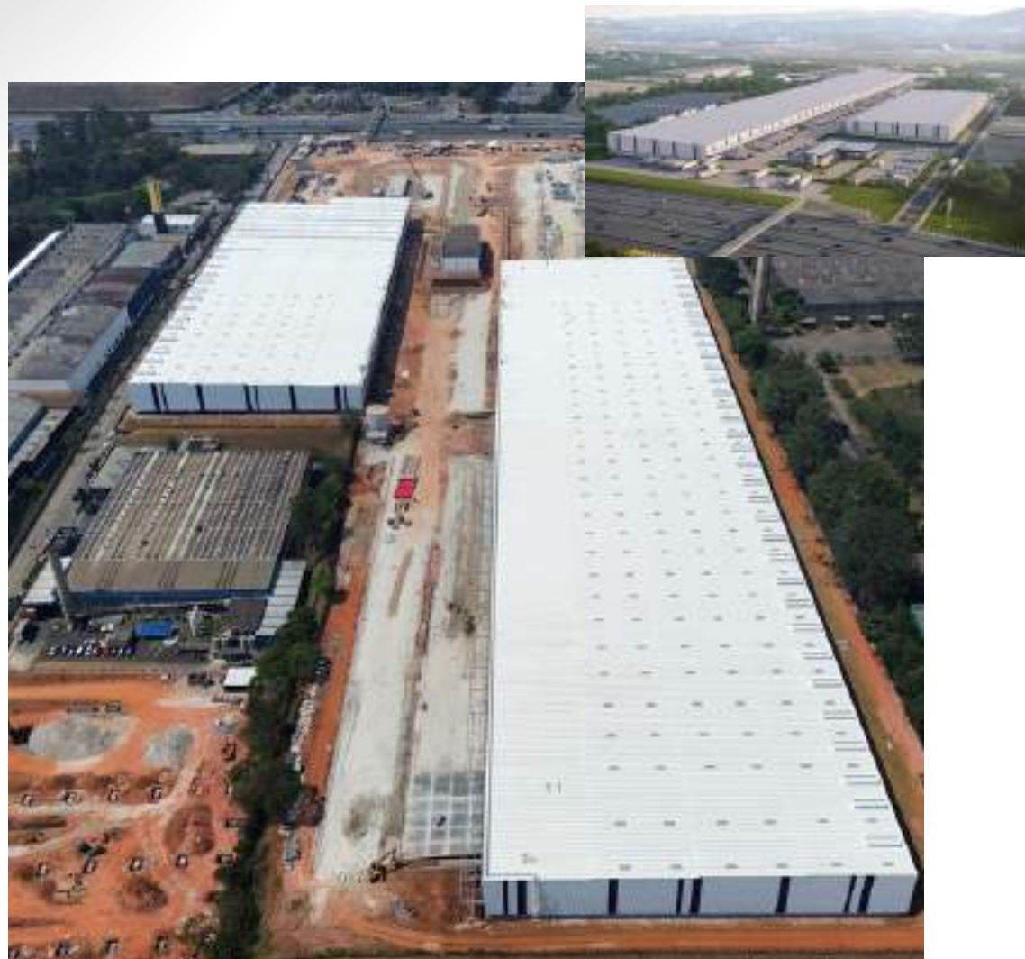
Nome: Centro Logístico Guarulhos Local: Guarulhos/SP Tipo: Centro Logístico Área Construída: 99.570 m 2