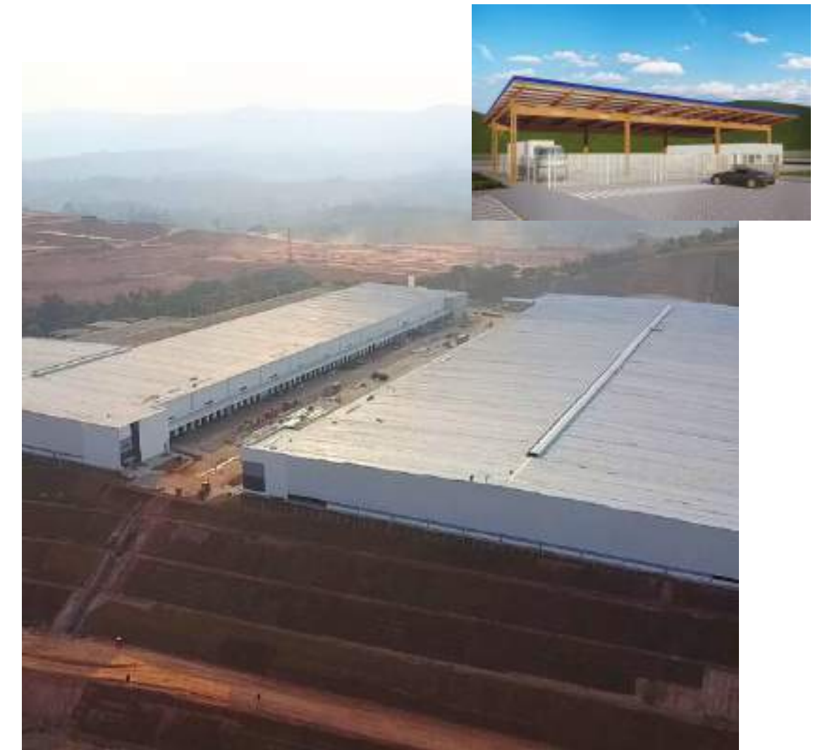
Nome: BPG Extrema Local: Extrema/MG Tipo: Centro Logístico Área Construída: 147.415 m 2