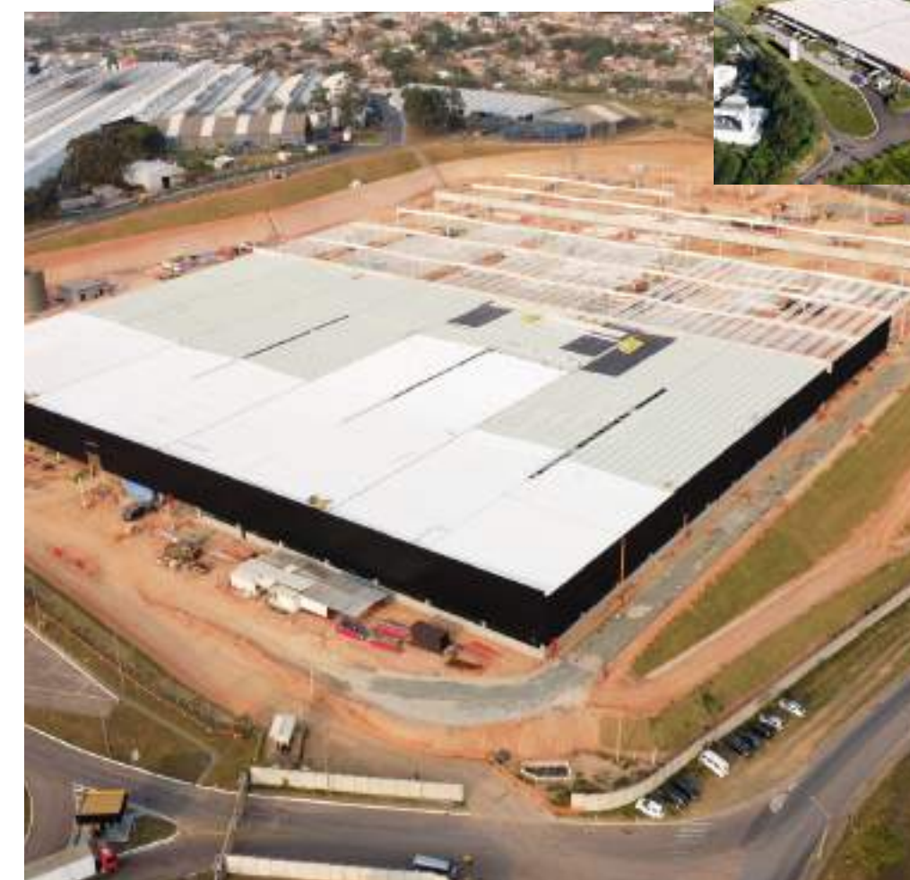
Nome: Galpão Pirelli Local: Campinas/SP Tipo: Ampliação Industrial Área Construída: 56.058 m 2