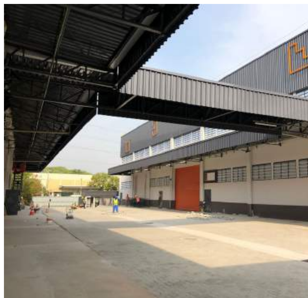
Nome: Goodstorage LAPA IV Local: São Paulo/SP Tipo: Retrofit Área Construída: 38.967 m 2