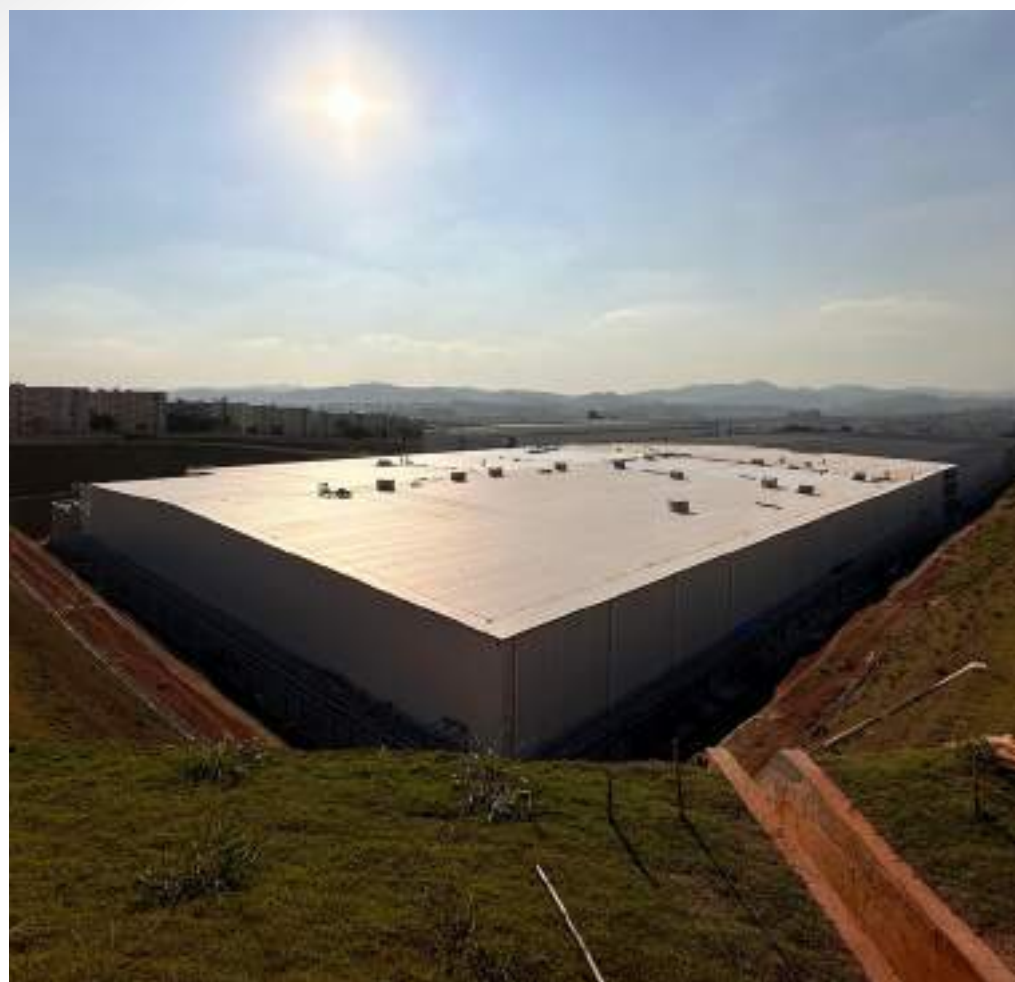
Nome: Emergent Cold Guarulhos Local: Guarulhos/SP Tipo: Centro Logístico Refrigerado Área Construída: 23.020 m 2