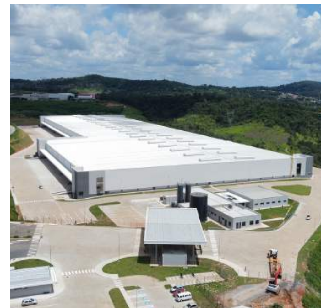
Nome: BRZ Neves Local: Ribeirão das Neves/SP Área Construída: 66.380 m 2