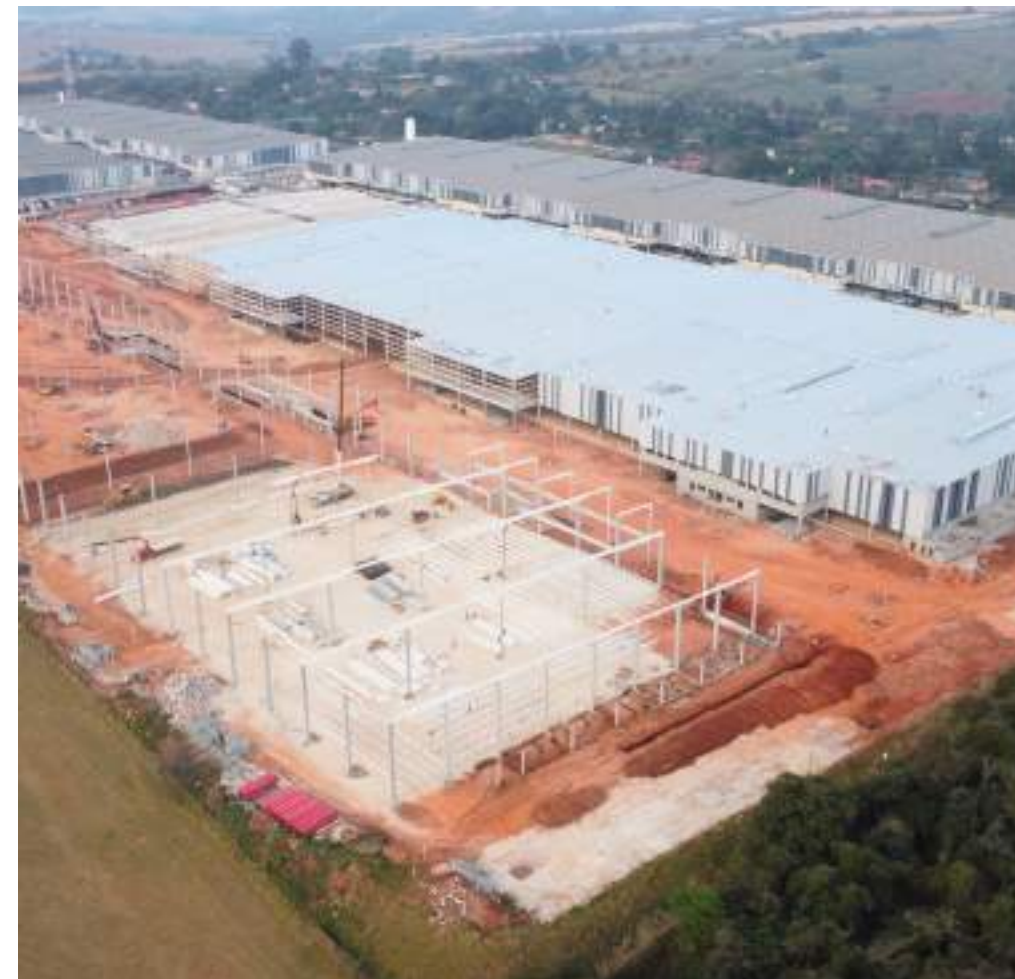
Nome: DVR Porto Feliz - Fase III Local: Porto Feliz/SP Tipo: Centro Logístico Área Construída: 101.343 m 2