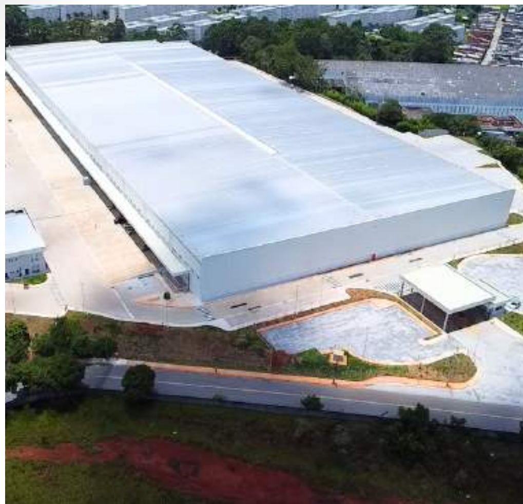
Nome: WTLOG ELEMENT Local: Guarulhos/SP Área Construída: 45.658 m 2