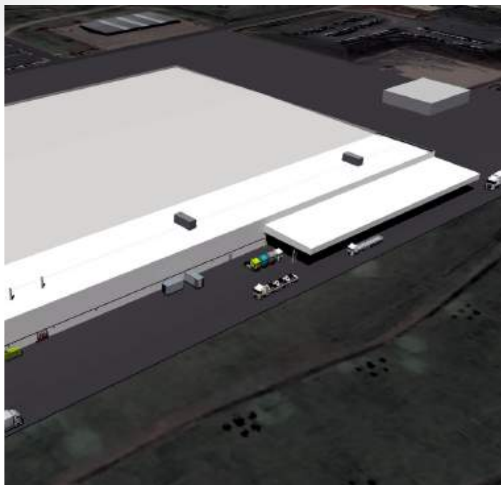
Nome: Expansão DAF PACCAR Trucks Local: Ponta Grossa/PR Tipo: Expansão Indústria Automotiva Área Construída: 6.000 m 2