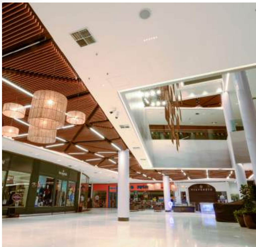
Nome: BR Malls - Center Shopping Uberlândia Local: Uberlândia/MG Área Construída: 2.500 m 2