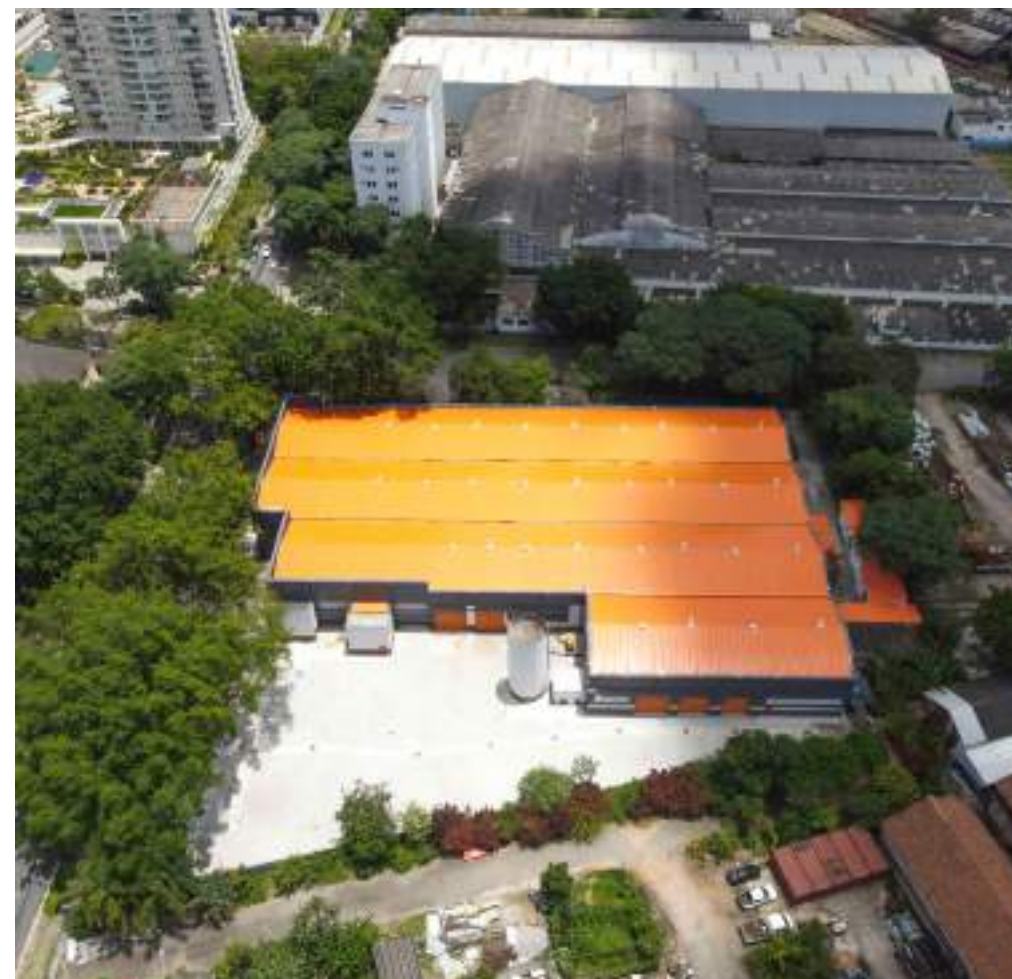
Nome: Goodstorage Alston I Local: São Paulo/SP Área Construída: 4.882 m 2