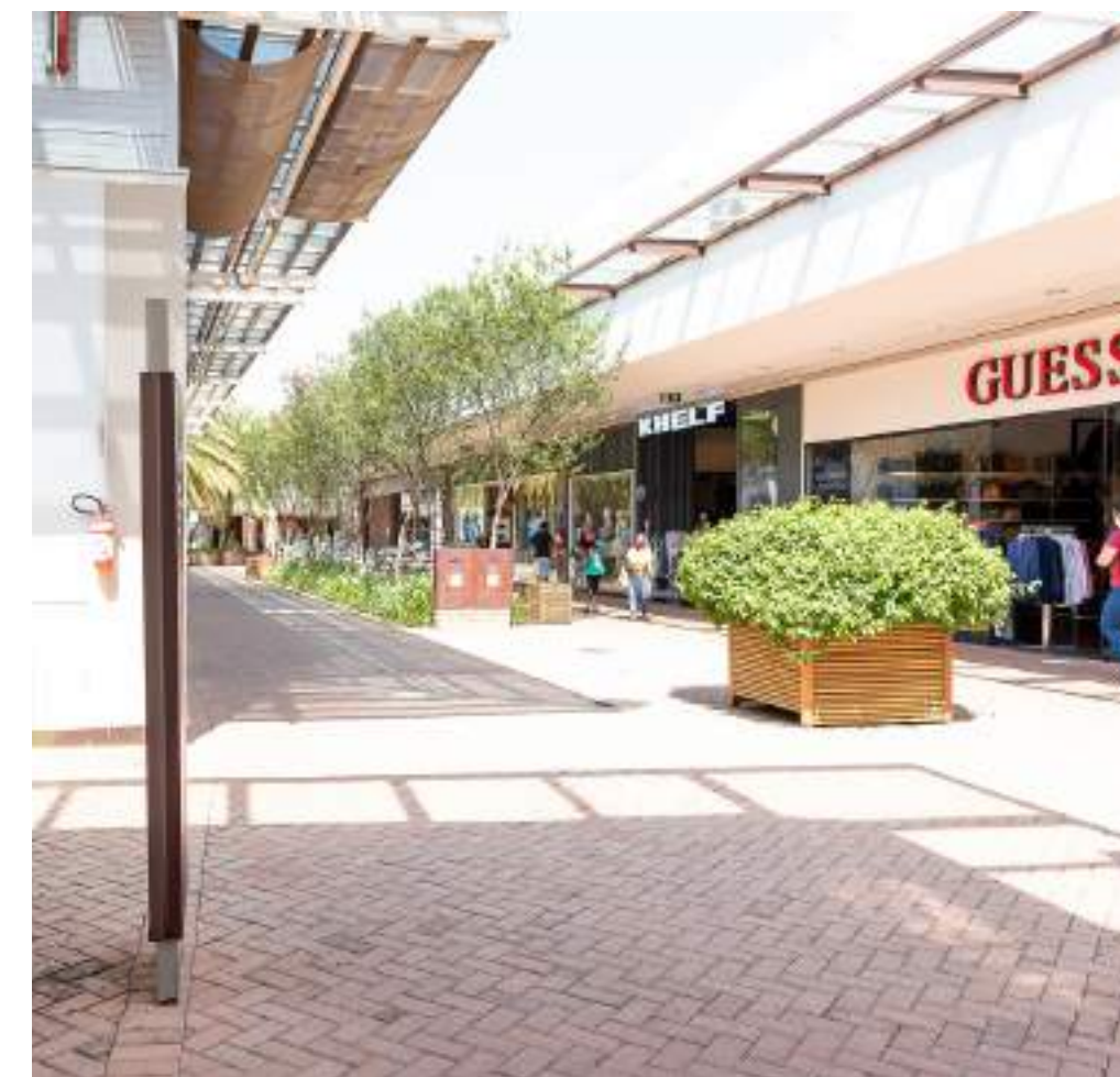
Nome: Expansão Catarina Outlet Local: São Roque/SP Área Construída: 7.000 m 2