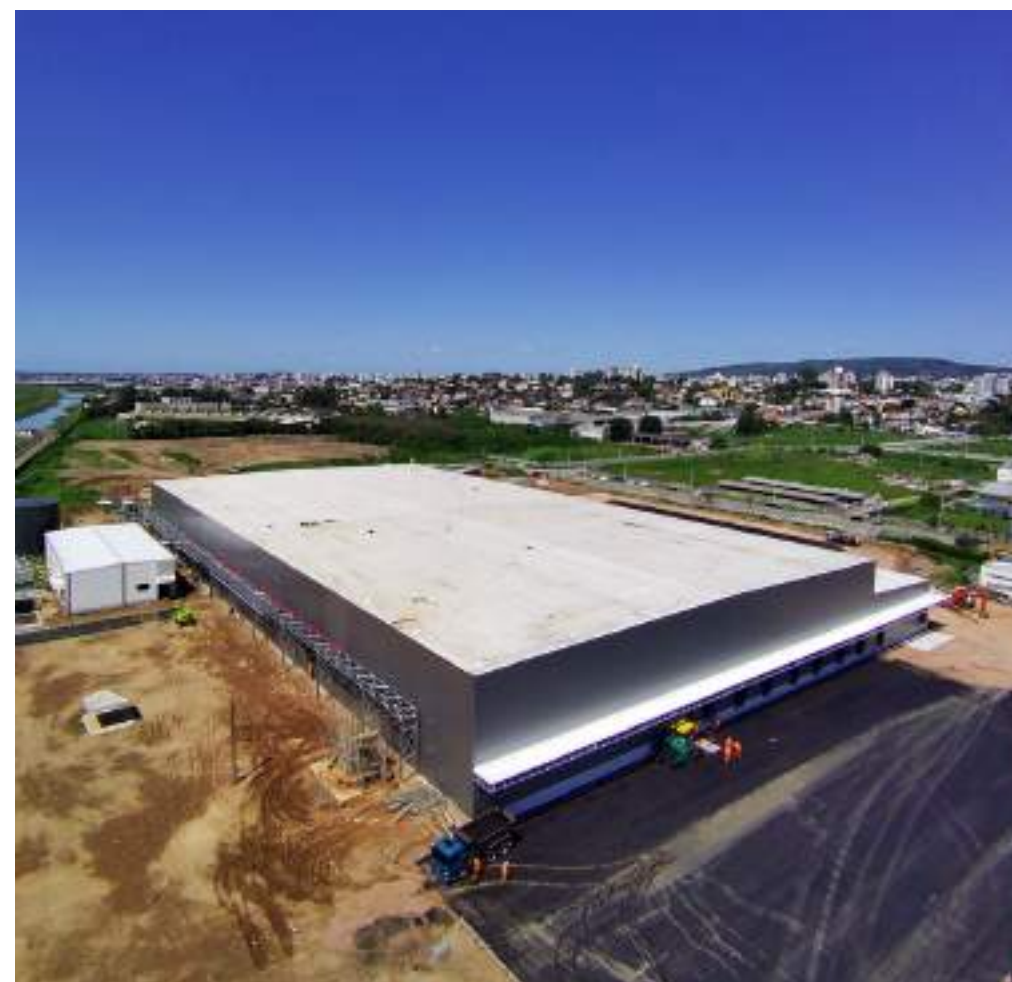
Nome: Zaffari Local: Porto Alegre/RS Tipo: Centro Logístico Refrigerado Área Construída: 13.937 m 2