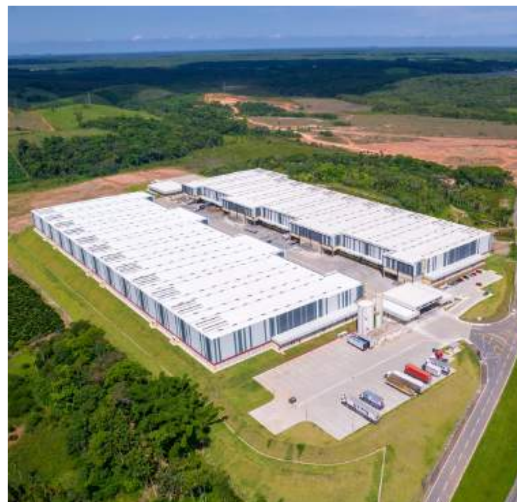
Nome: DVR Araquari - BMW Local: Araquari/SC Área Construída: 51.000 m 2