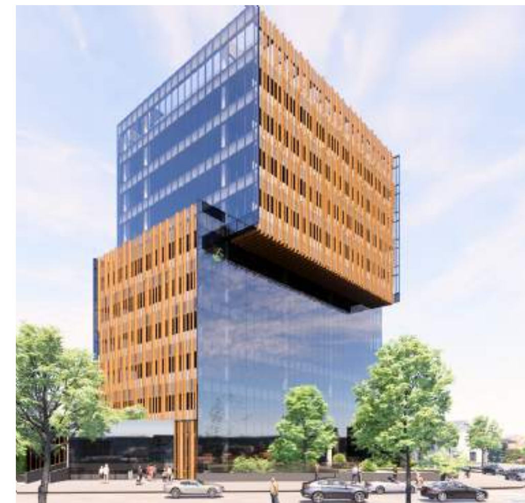
Nome: BRZ Joaquim Floriano Local: São Paulo/SP Tipo: Comercial Área Construída: 16.924 m 2